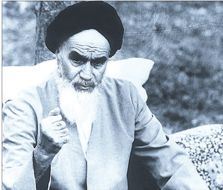
Prägte den heutigen Iran: Ajatollah Khomeini. Am Donnerstag wurde der 28. Jahrestag der Revolution begangen. Doch das Fundament bröckelt.

Schweizer zeichnet ein nuanciertes Iran-Bild: „Das Land ist kein homogener Ideologie-Block.“ Seine Thesen belegt der Kulturwissenschaftler mit Beispielen – und schwäbischem Akzent. Nein, auch antisemitisch sei der Iran nicht: „Aber ganz klar antizionis-